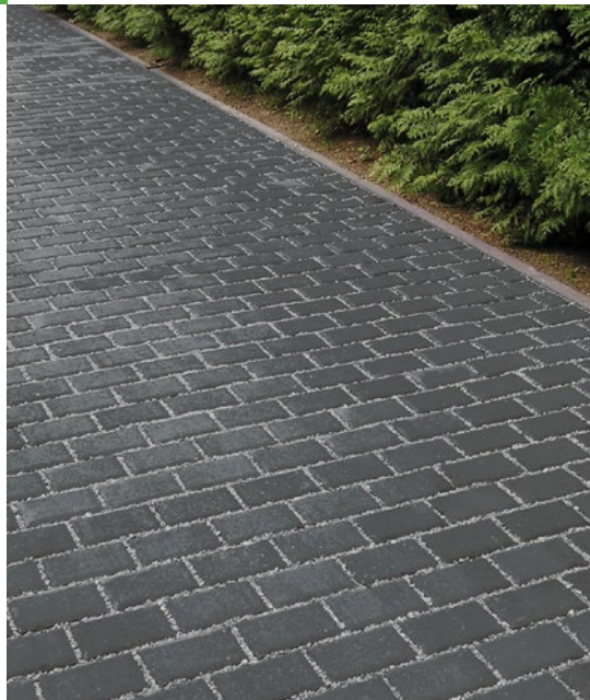
AQUILA DRAINFUGENPFLASTER anthrazit ↑