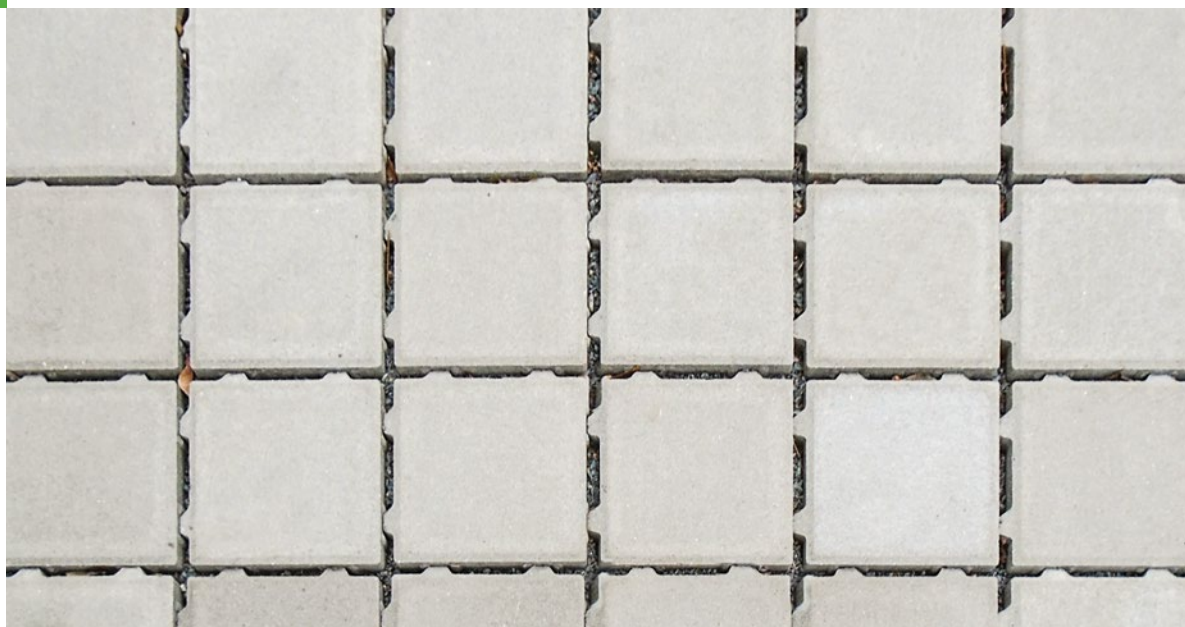
PARCO DRAINFUGENPFLASTER grau