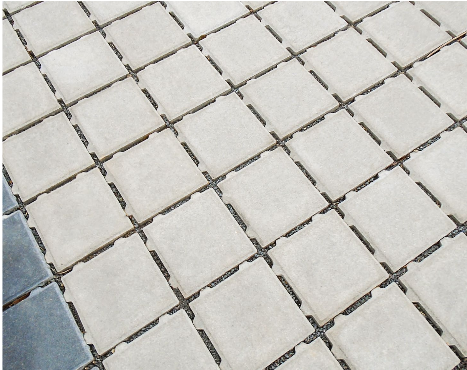
PARCO DRAINFUGENPFLASTER grau und anthrazit