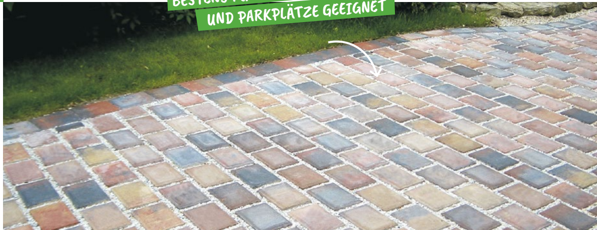
RASATO RASENFUGENPFLASTER herbstlaub

BESTENS FÜR EINFARTEN UND PARKPLÄTZE GEEIGNET