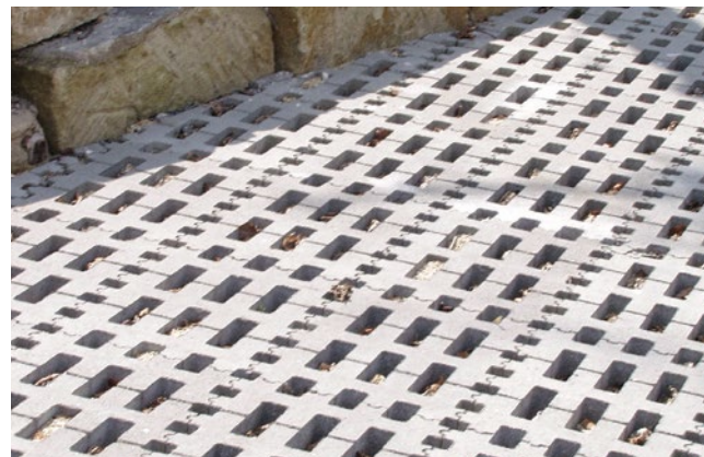
REMA RASENGITTERPLATTE grau

*) Nur im Werk Ellwangen verfügbar. Nicht erhältlich im Werk Altenburg.