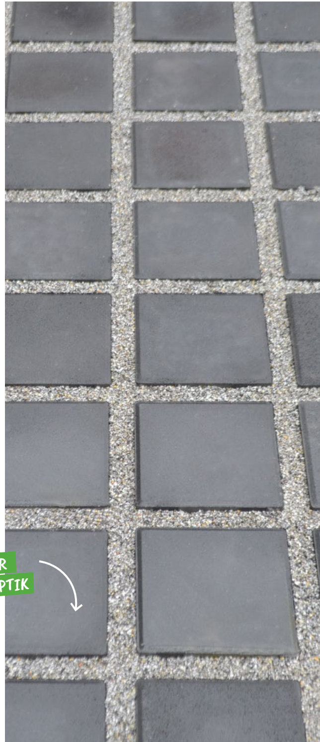
VIRNGRUND RASENFUGENPFLASTER anthrazit

HOCHBELASTBARES ÖKO-PFLASTER MIT LEBENDIGER OPTIK