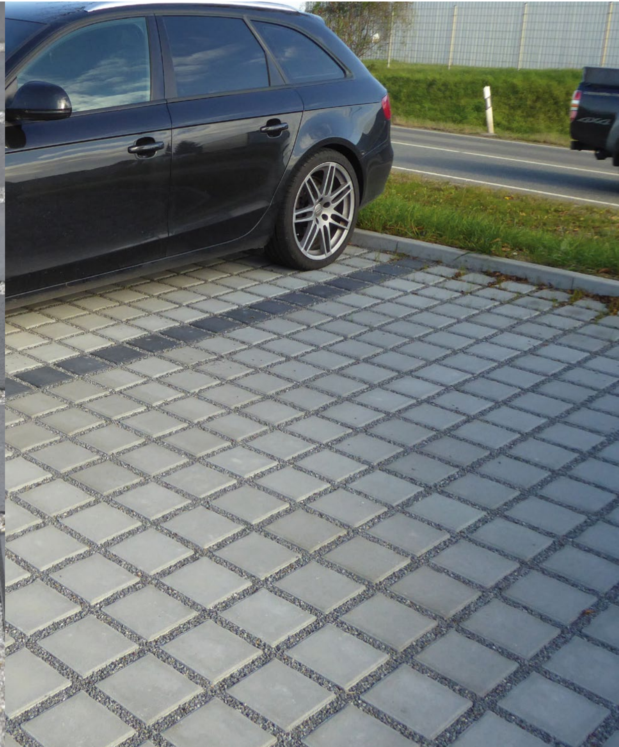
VIRNGRUND RASENFUGENPFLASTER grau