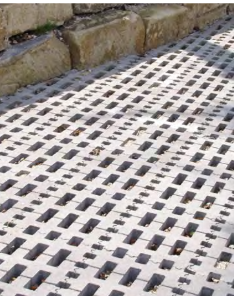
REMA RASENGITTER grau