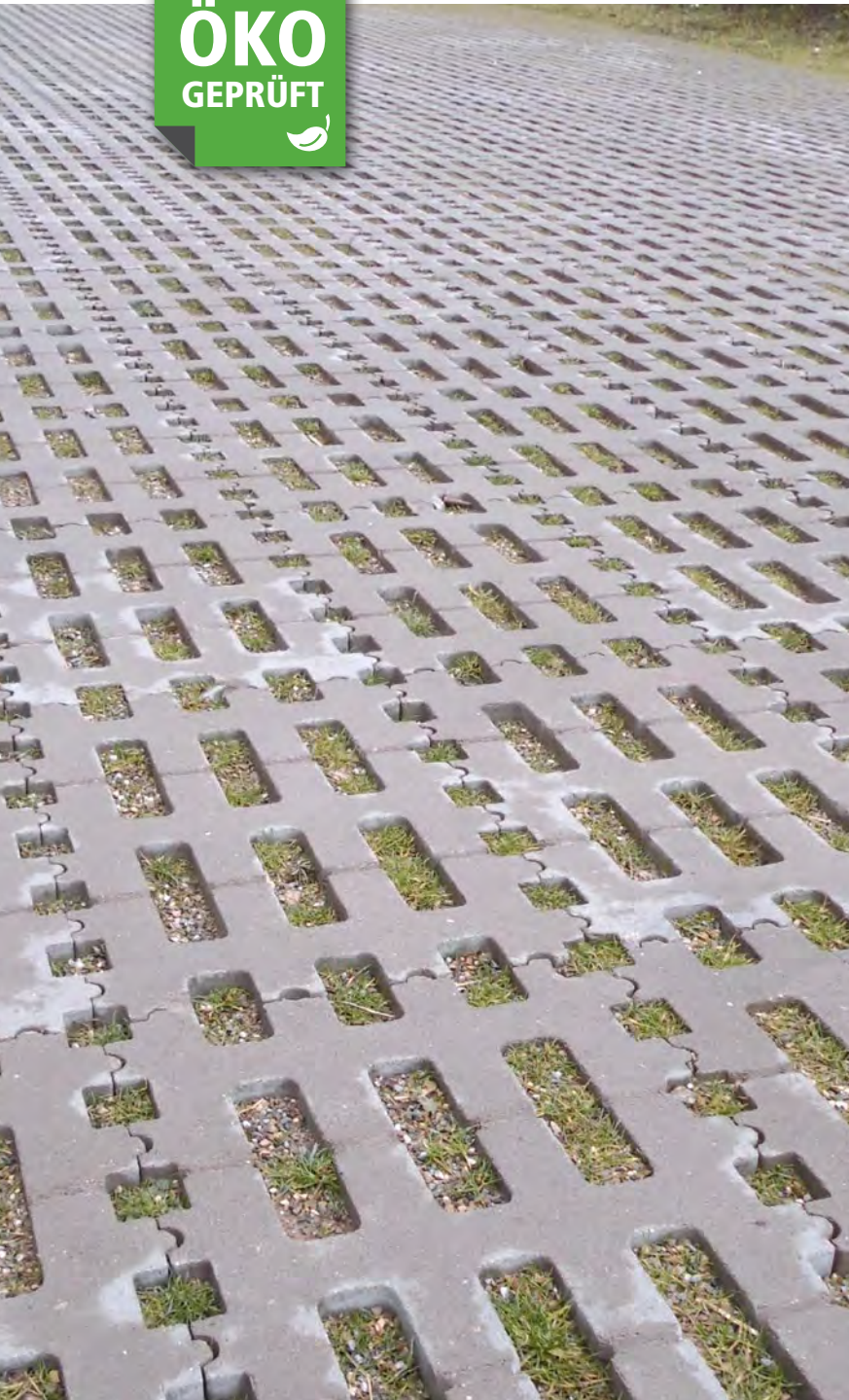
REMA RASENGITTER grau